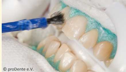
Power-Bleaching beim Zahnarzt: Auftragen des Bleaching-Gels

Wenn Sie die Praxis wieder verlassen, können Sie sich an sichtbar helleren Zähnen freuen!